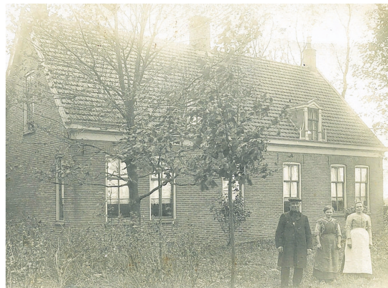
▲ Woonhuis, Rijndijk 3, Hazerswoude-Rijndijk.