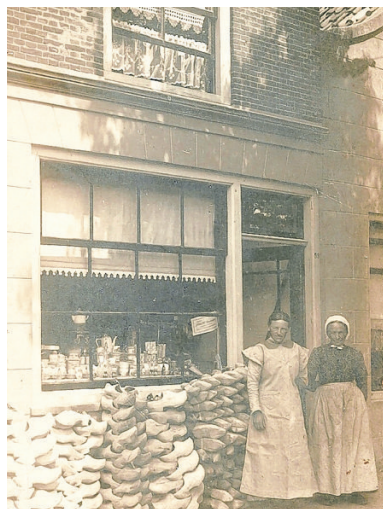
▲ Winkel in huishoudelijke artikelen en klompen, Karnemelksloot, Gouda.