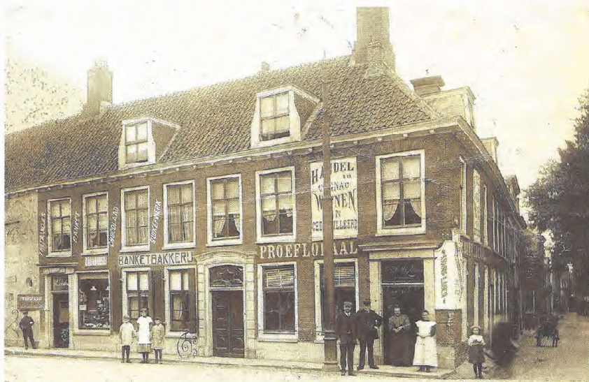
▲ Hoek Gansstraat en Oosterkade, een karakteristieke foto van de joodse straatfotograaf Sanders.

Meester beschikt intussen over tientallen foto's van Sanders die in Utrecht gemaakt zijn. Sommige foto's zijn extra bijzonder, omdat de panden al jaren uit het stadsbeeld verdwenen zijn. Neem die foto van de hoek van de Gansstraat met de Oosterkade, met daarop de banket-